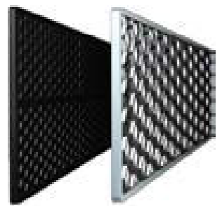
Active Carbon- und Silberionenfilterstreifen

Die AMBER Wandklimaanlage passt dank ihres minimalistischen Designs in jeden Innenraum. Neben ihrem unauffälligen Erscheinungsbild überzeugt sie mit einfacher Bedienung, 3D-Luftauslass und 7 Ventilatorstufen.